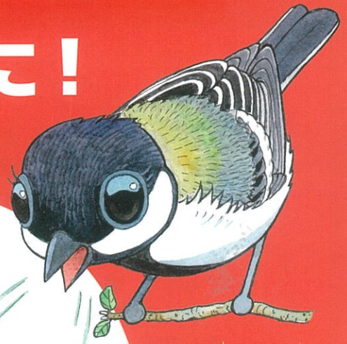
シジュウカラの親