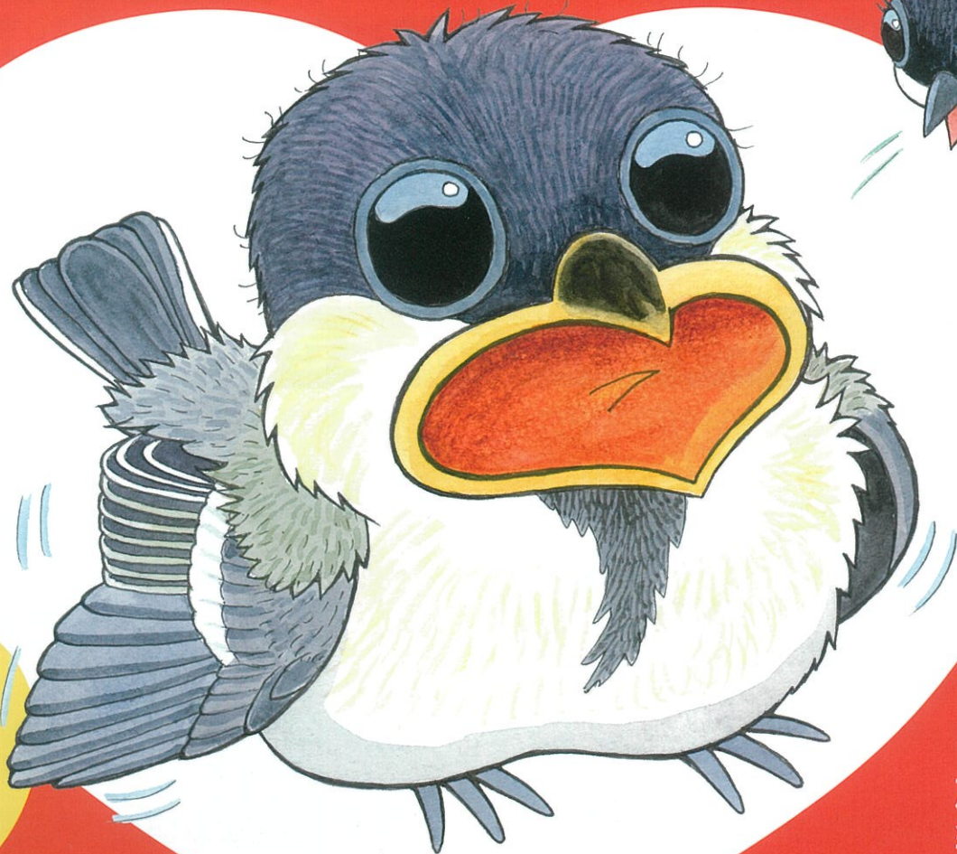
シジュウカラのヒナ